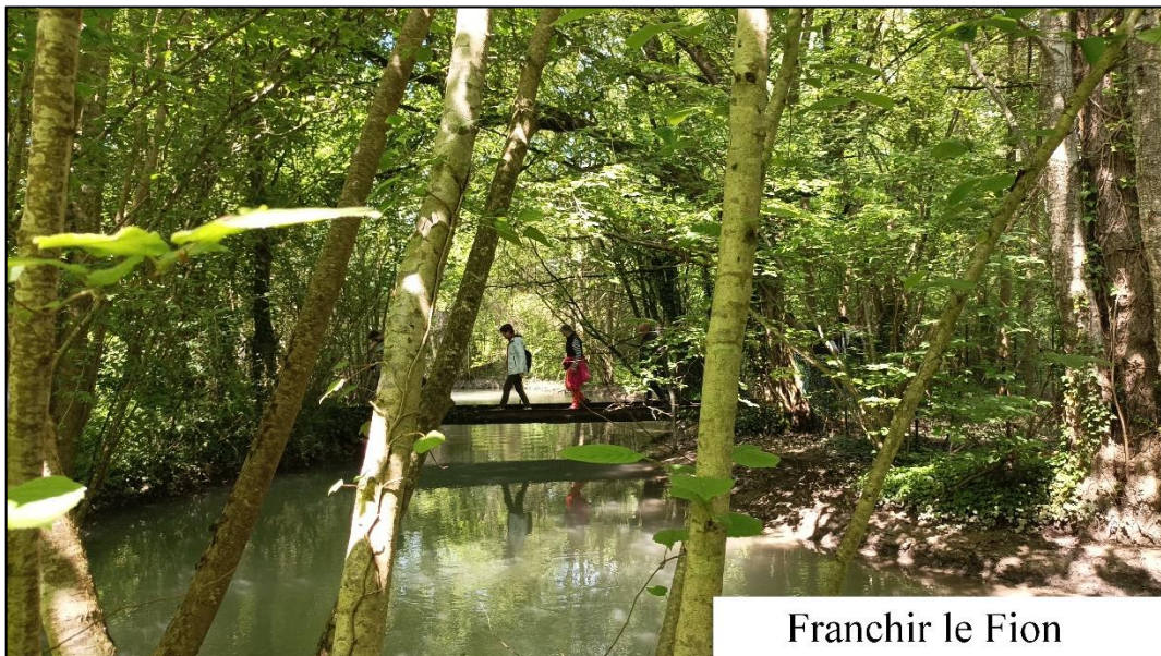
Franchir le Fion

L'après-midi, consacré au milieu humide, débute au cœur du village avec le Moineau, la Tourterelle turque, le Pigeon ramier, le Merle et les deux Hirondelles de fenêtre et rustique. Le village est traversé par le Fion, affluent de rive droite de la Marne, long de 22 km. A l'issue d'un hiver et d'un début de printemps pluvieux, le niveau de l'eau est haut.