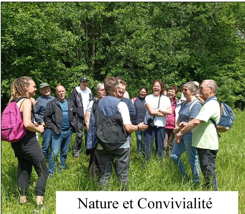
Nature et Convivialité

Cette journée, placée sous le signe de la convivialité, s'achève. Le constat est unanime : le patrimoine naturel du territoire Chausséen est d'une grande richesse. Notre devoir est de la préserver !