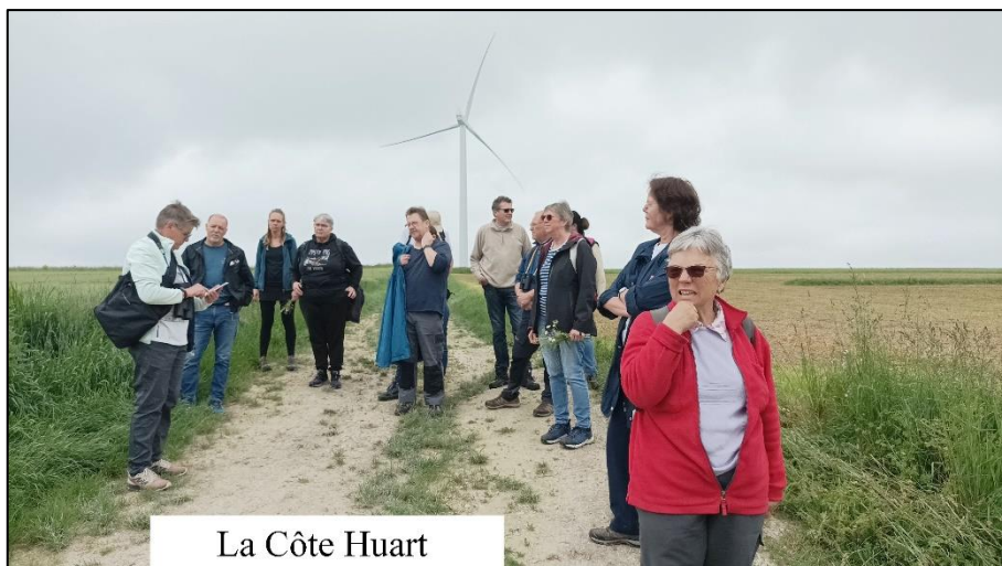
La Côte Huart

Nous montons la « Côte Huart » où nous avons la chance d'observer plusieurs couples de busards cendrés. Arrivés depuis peu, ils sont en reconnaissance afin de choisir leur site de nidification dans les champs de céréales. Nous descendons le « Champ la Meule » où plusieurs lièvres offrent le spectacle du bouquinage. D'autres chants d'oiseaux révèlent la présence du Pouillot véloce et du Pinson des arbres.