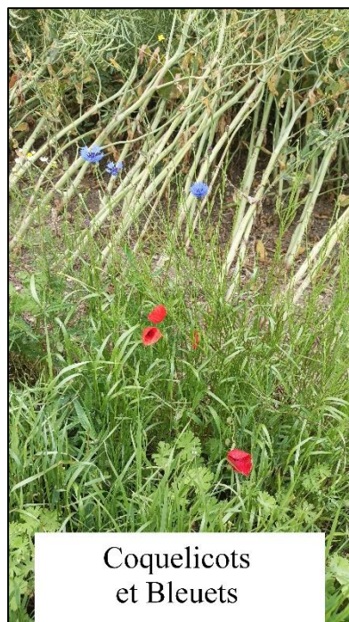
Coquelicots et Bleuets