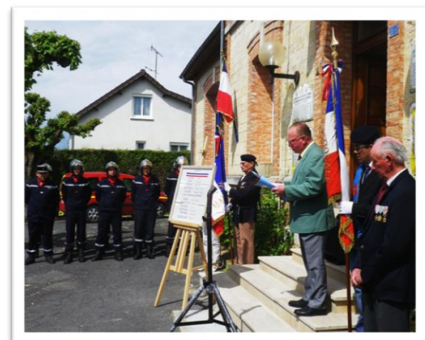
lecture du discours du 8 mai 1945