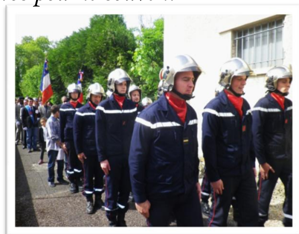
suivie d'un défilé jusqu'à la mairie