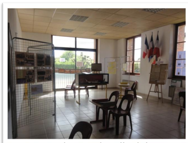
Exposition dans une des salles de la mairie

Les membres de l'association tiennent à remercier