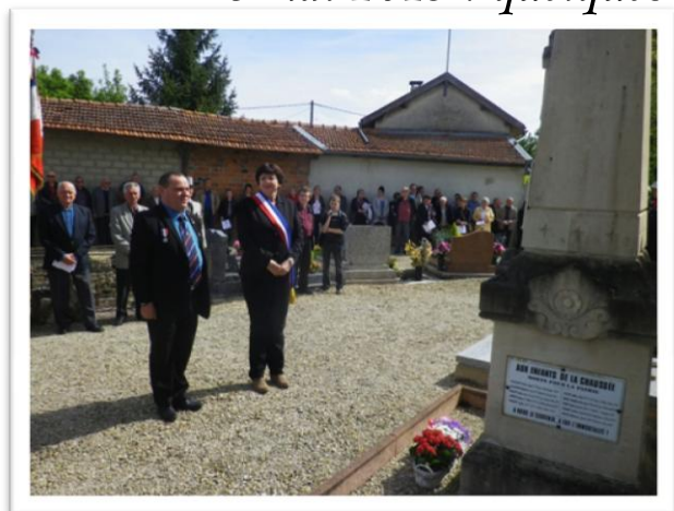
Cérémonie au monument aux morts