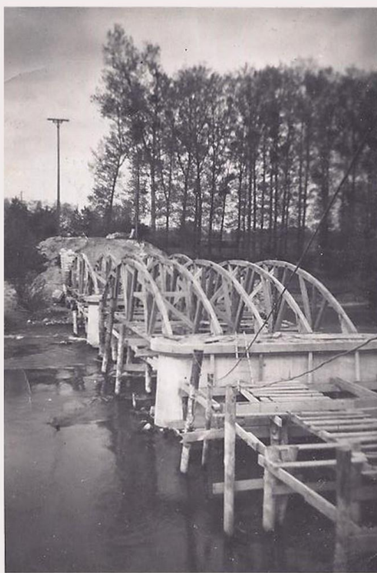
Le pont de La Marne hiver 1941-42

Les travaux de reconstruction des ponts s'achèvent en 1947. Le 19 mai 1947, c'est l'inauguration.