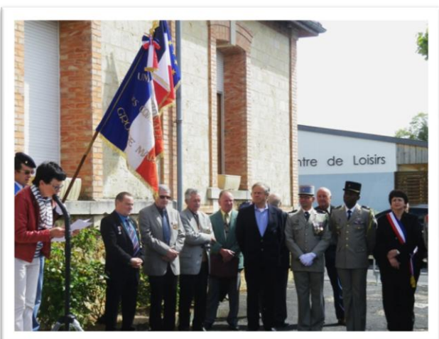
Hommage aux victimes de la guerre